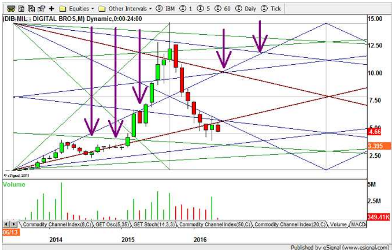
Figure 3: Digital Bros. monthly chart

I crocevia del Gann Box sono gli incroci delle trendline. In Figura 3 sono stati evidenziati con una freccia viola tutti gli incroci passati e alcuni futuri.