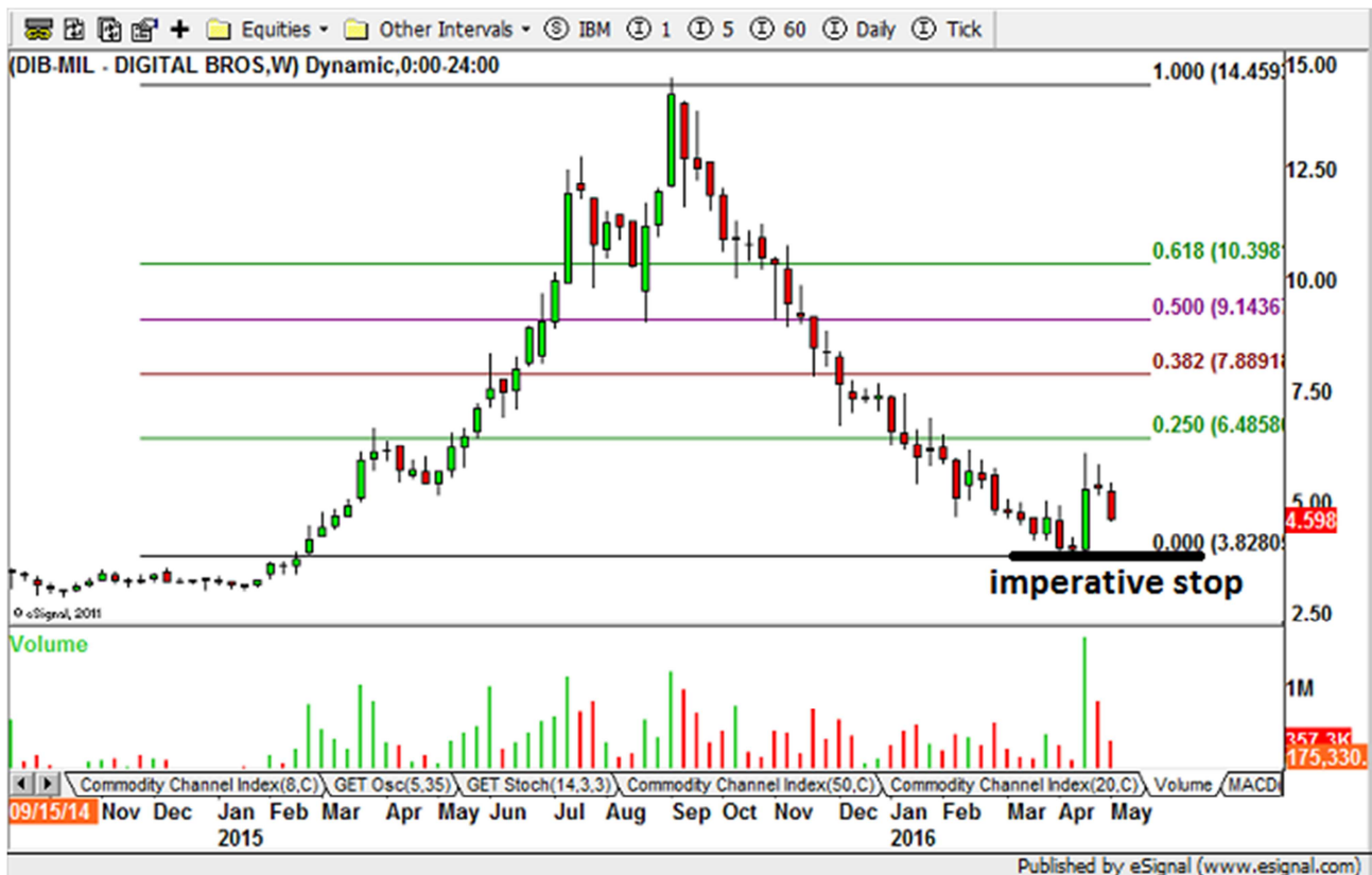
Figure 4: Digital Bros weekly chart

Passiamo quindi alle due note dolenti del titolo in questione: la prima e' che si tratta di un titolo con poco flottante, con scambi abbastanza rarefatti. Cio' comporta che per costruire una posizione cercando di evitare di far muovere troppo il prezzo si dovranno operare dei mini acquisti lungo tutto la giornata, e di conseguenza anche nel caso dell'uscita la vendita dovra' necessariamente essere fatta a piu riprese.