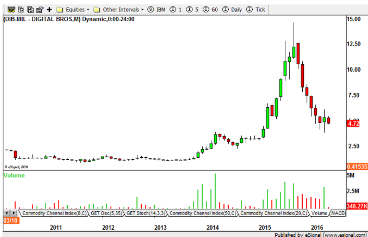
Figure 1: Digital Bros monthly chart

Il grafico qui sopra è un mensile dell'azione Digital Bros. alcuni si staranno chiedendo se si tratti di un'azione quotata al Nasdaq magari, e invece no. E' un'azione quotata a Milano con sede a Milano, di proprietà italiana ma presente nei principali centri nevralgici della tecnologia nel mondo. Quindi un ottimo esempio di capacità italiana del fare e dell'essere intraprendenti.